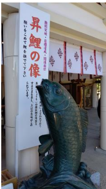
(広島護国神社にある昇鯉の像)