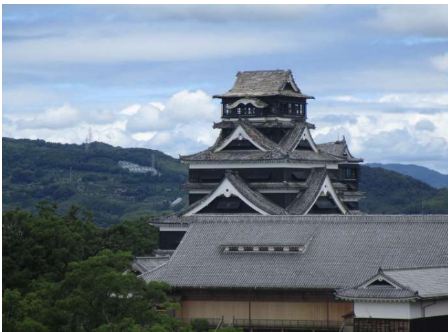
↑ 無残な屋根を晒すシャチホコも瓦もない天守閣。(レストランから同じ高さで見える天守閣)