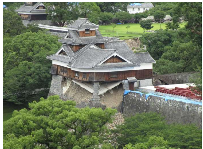
↑ 一本足の石垣で支えられている飯田丸五階楼(レストランから見下ろす飯田丸五階楼)