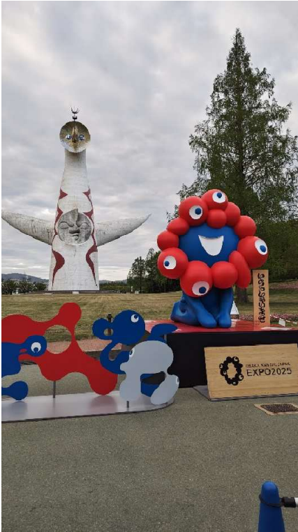
<太陽の塔とミャクミャク>