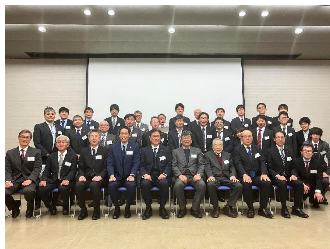
（周南支部総会での集合写真）