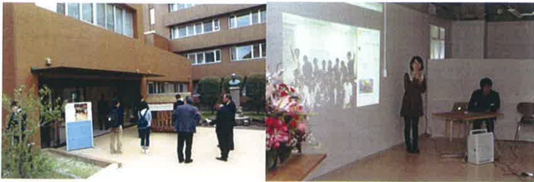
写真 正面入り口とウッドデッキ （右手に川口虎雄先生寿像）

学生のための情報発信基地「おもしろラボ（仮称）」のオープニングセレモニーが平成 28 年 4 月 13 日（水）に行われまして、専務理事が出席いたしました。この「おもしろラボ（仮称）」には本部だより NO. 7 (2015-3) においてお知らせしましたように、既存の全額共通スペースを学生情報発信基地にリニューアルしたものです。本同窓会から大学教育支援として 210 万円の支援をいたしました。この「おもしろラボ」では学生が主体的に活動し情報発信を行う場として活用されることが期待されていまして、セレモニーも学生が中心となりおこなわれました（写真）。