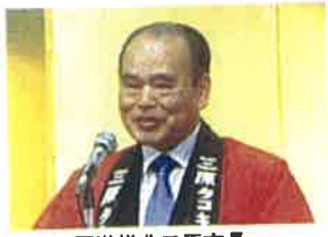
天満祥典三原市長